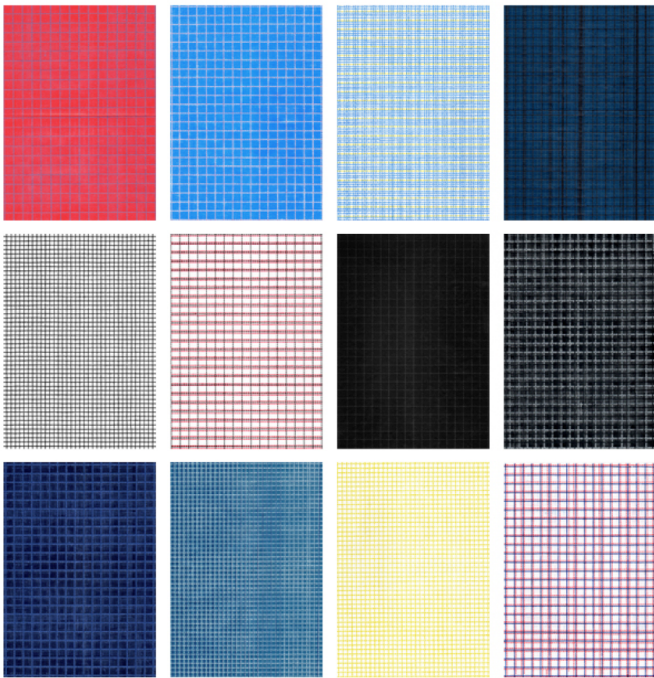
Squares , tapuscrit sur papier, papier carbone, dimensions variables, 2012