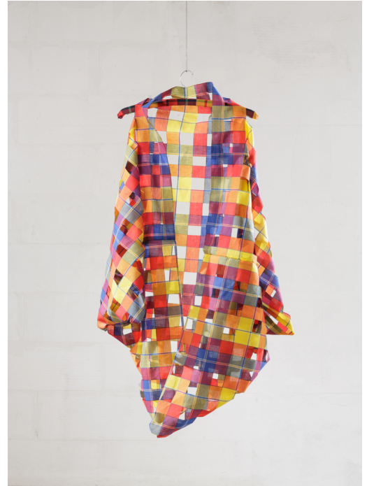
Madras , tissu découpé, 122x122 cm, série de 6, 2017

Della Olga configure sa pratique à l'ère des services, de la post-industrialisation et du capitalisme à outrance sous une forme non-reproductible mais de l'ordre de la répétition laborieuse et auto-génératrice, teintée de hasards objectifs et subjectifs. Dans une forme de maïeutique, l'artiste cherche l'éloquence à travers un mode opératoire choisi tout en laissant la place aux intuitions aléatoires, comme une cosa mentale appliquée où le corps et l'action sont tout aussi déterminants. Ayant précédemment exercé le métier d'avocate, Raffaella della Olga développe ses démonstrations systémiques en s'octroyant des libertés sous contraintes.